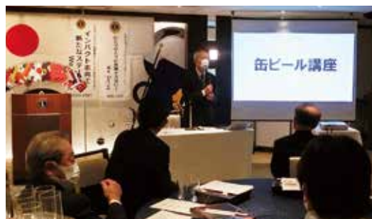
ゲストスピーチ例会