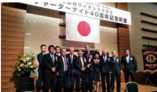
仙台社LCCN40周年記念例会