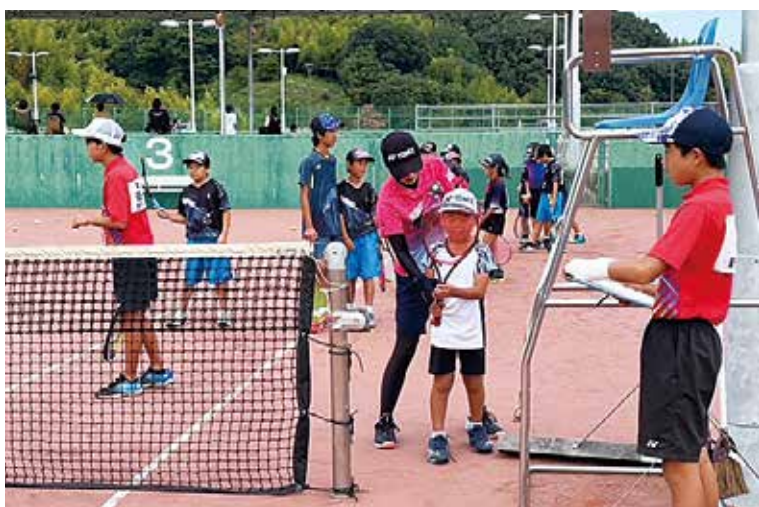
今治市のジュニア指導講習会

ソフトテニスを通じて、ジュニア層の普及を図るとともに、スポーツの楽しさ、周りの人に感謝する気持ちを持ってもらうように指導していきたいと思っています。