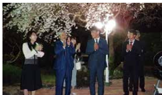
今井邸での花見例会