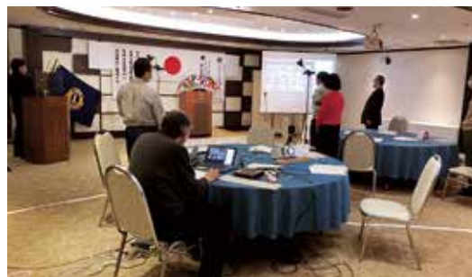
コロナ感染拡大でZOOM例会