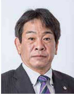
広島紅葉ライオンズクラブ 大会会長