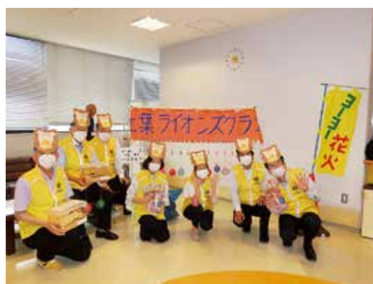
広島市北部子ども療育センター夏祭り