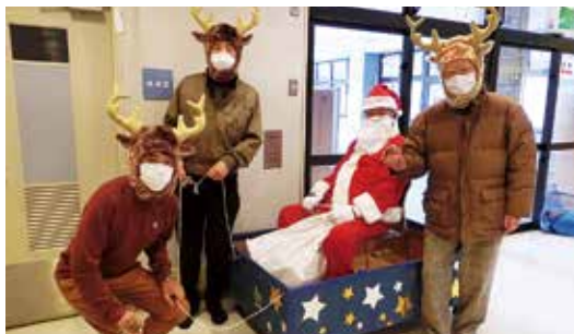
北部子ども療育センタークリスマス会