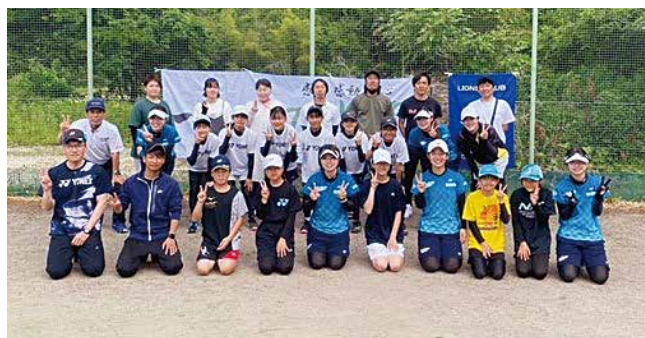
島根県のジュニア指導講習会