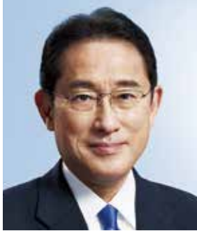
前内閣総理大臣・衆議院議員