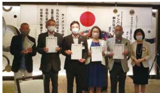
広島ふたばクラブ支部 結成