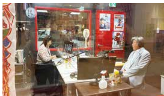
ラジオ出演で盲導犬ACTのPR