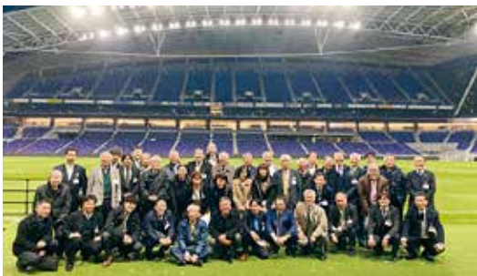
ピースウィング広島にて広島平和LCと合同例会