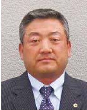
広島平和ライオンズクラブ 会 長