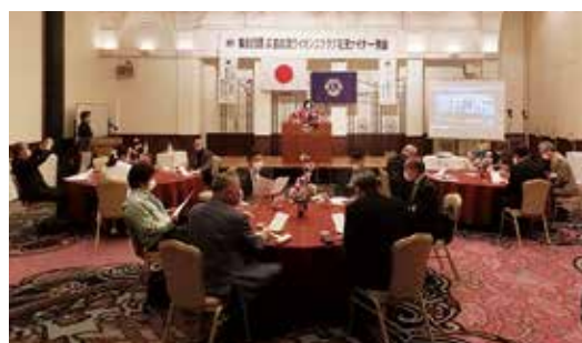
花見ナイター例会