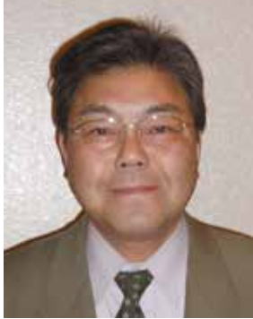
ライオンズクラブ国際協会332-C地区 1 R 2 Z 仙台杜ライオンズクラブ 会 長