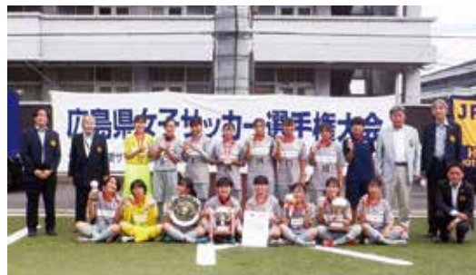
広島県女子サッカー選手権大会主催