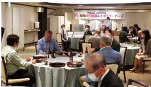
コロナで自粛明けの久しぶりの例会