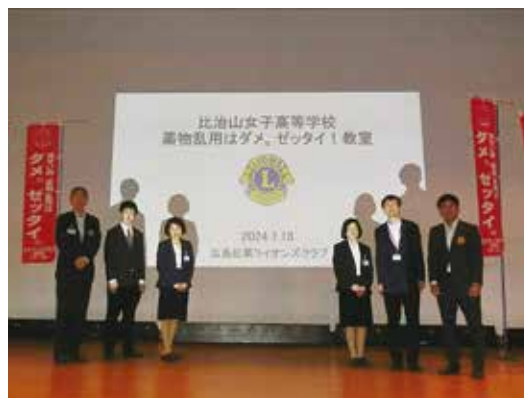
薬物乱用防止教室 開催