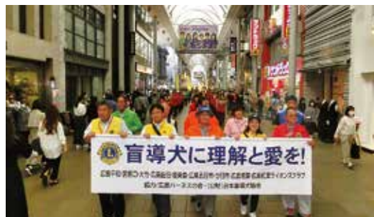
2年ぶりの本通りパレード