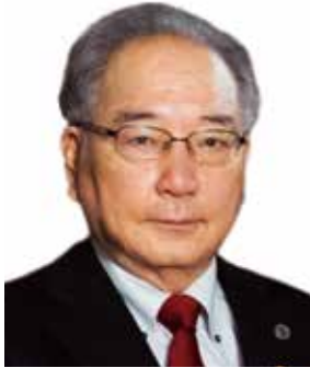
ライオンズクラブ国際協会336-C地区 地区ガバナー