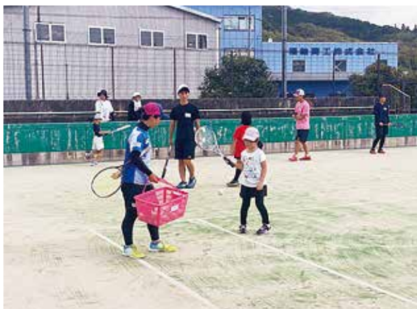
庄原STCジュニア指導講習会

ソフトテニスを通じて、ジュニア層の普及を図るとともに、スポーツの楽しさ、周りの人に感謝する気持ちを持ってもらうように指導していきたいと思っています。