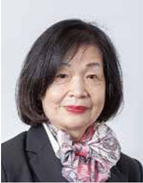
広島紅葉ライオンズクラブ 大会委員長