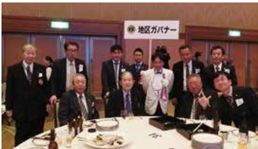
第70回336-C地区年次大会